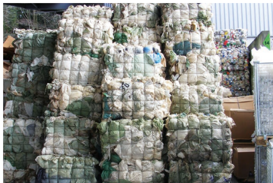
Déchets de films d'enrubannage propres et parfaitement comprimés en vue d'une bonne utilisation des capacités de transport et d'un recyclage efficace.

La Suisse consomme annuellement plus de 1,1 millions de tonnes de matières plastiques. L'agriculture contribue pour environ 15.000 tonnes, une part relativement modeste, mais comme le taux de recyclage y est particulièrement faible, la plupart des déchets plastiques sont incinérés et génèrent des émissions de CO 2 .