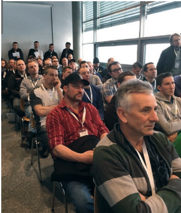
... als auch die Fachreferate zu verschiedenen Themengebieten.