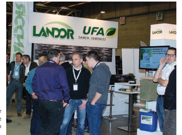
Zeit für Fachgespräche bei den Ausstellern.